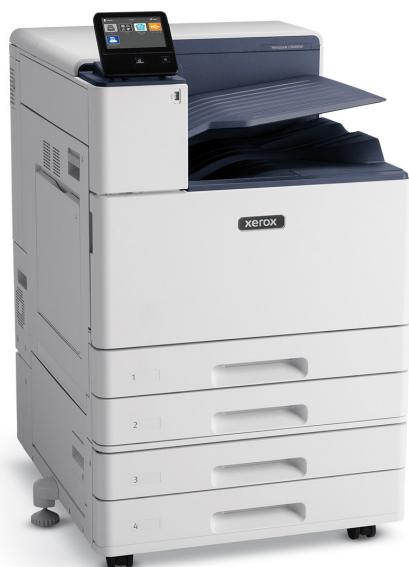
VersaLink® C8000W с двухлотковым модулем